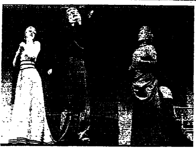
«عدو الناس» لسين، أخرج ادمو فونيلو